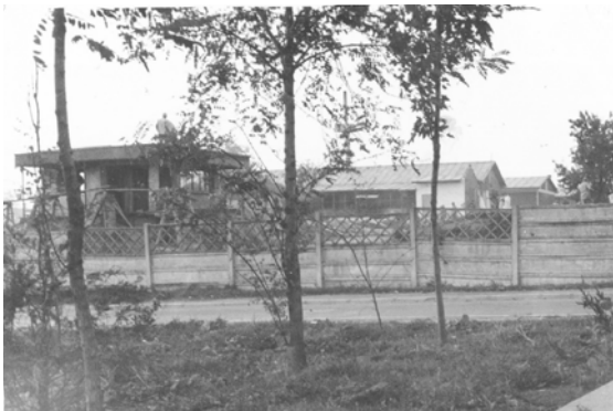
Тюрьма в Яссы, где Костикэ был с июля по сентябрь 1985 г.