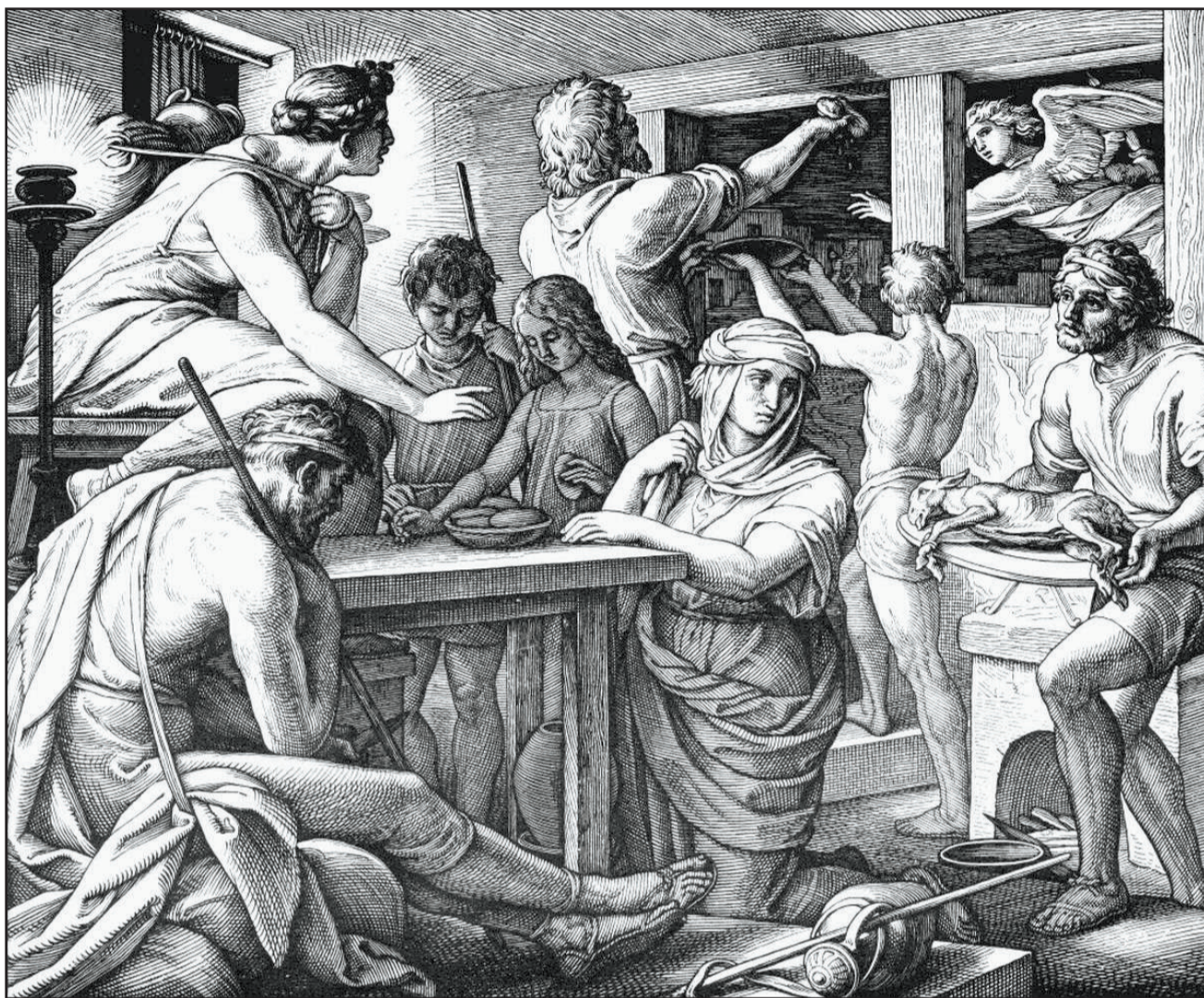
Первая иудейская Пасха в ветхозаветное время

Изначально праздник был исключительно иудейским. Мы можем прочитать о нем подробно в Библии, в книге Второзаконие 16, 1–2: «Наблюдай месяц Авив и совершай Пасху Господу, Богу твоему, потому что в месяце Авиве вывел тебя Господь, Бог твой, из Египта ночью. И заколай Пасху Господу, Богу твоему, из мелкого и крупного скота на месте, которое избрет Господь, чтобы пребывало там имя Его».