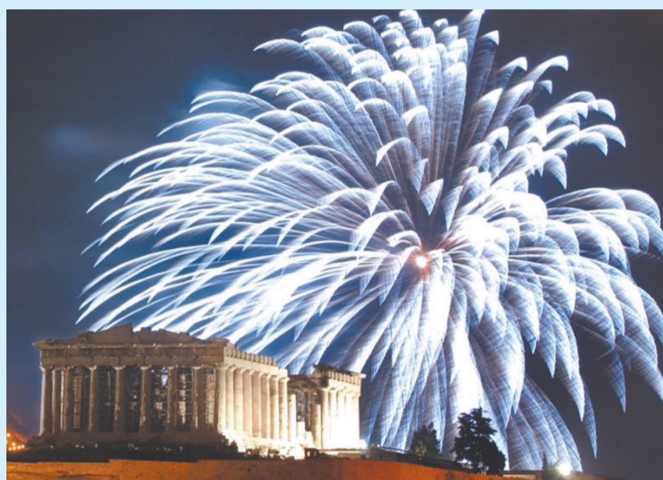
Рождество в Афинах

Греция – православная страна, но празднует Рождество вместе с западным миром 25 декабря (хотя в Греции есть верующие, которые продолжают следовать старому стилю и отмечают праздник в то же время, что и Русская Православная церковь). Рождество – один из самых любимых праздников в Греции. Его отмечают в каждом доме в кругу семьи. Наряжается рождественская ёлка, праздничный стол украшается различными плодами, которые рождает земля: фруктами, орехами, инжиром, изюмом... Все пребывают в ожидании подарков. Здесь обычно дарят на Рождество одежду, книги, предметы домашнего обихода, просто деньги в конвертах, и, конечно же, игрушки для детей. В Афинах – столице Греции – в последнее время праздник сопровождается грандиозными салютами.