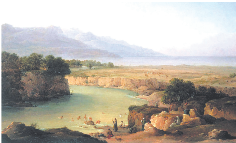
Река Иордан во времена Иоанна Крестителя

А что же в действительности произошло? Давайте попробуем немного в этом разобраться. Страницы Библии повествуют о том, как на рубеже эпох в далёкой Палестине пророк Иоанн, единственный сын израильского священника Захарии, начал крестить людей в реке Иордан. Вероятно, крещение было связано с древним ритуалом иудеев омыться в целях гигиены. Также эти омовения являлись символом духовного очищения. Так было когда-то заповедано Богом. Через обряд крещения в древности проводили язычников, принимавших иудейскую веру. К Иоанну же приходили совсем не язычники, а израильтяне, осознающие свою греховность, причём совершенно разных социальных категорий. Среди них были те, кого не любили и не принимали в хорошем обществе, – мытари (сборщики налогов), были и воины, а также самые уважаемые представители своего времени – фарисеи и садуккеи. Люди желали принять кре-