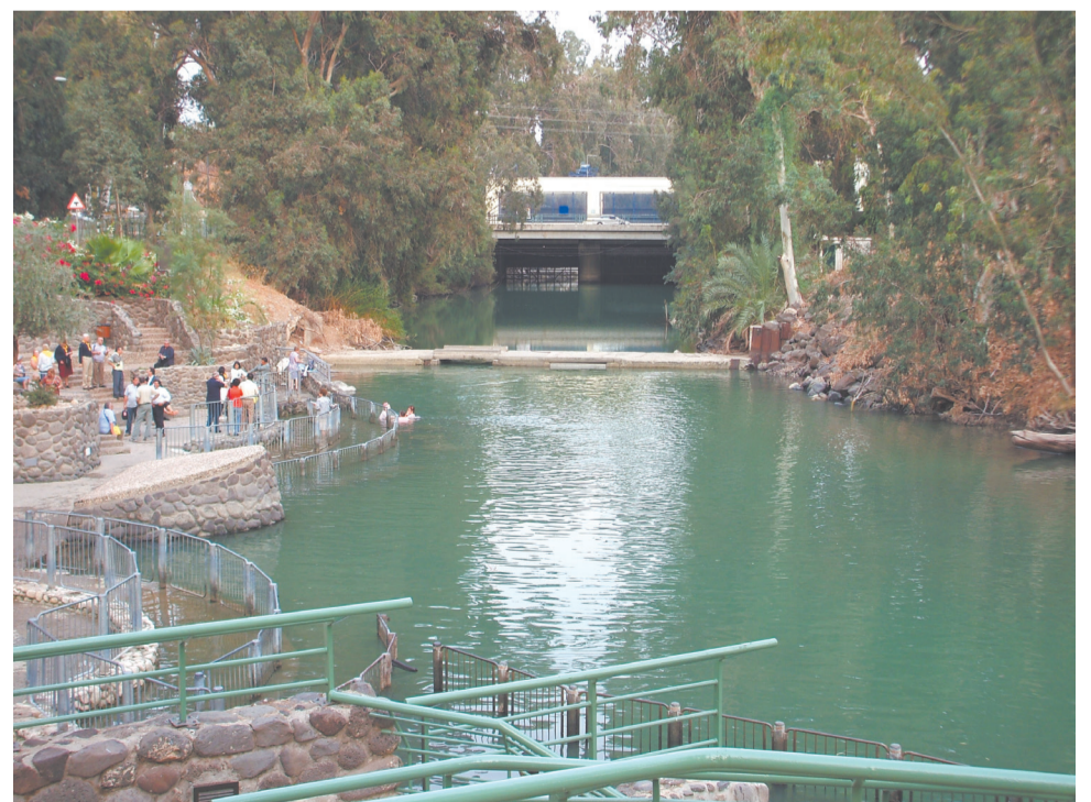
Река Иордан в настоящее время