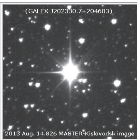
Вспышка новой звезды в созвездии Дельфина, обнаруженная 14 августа 2013 г. Слева – звезда, еле видимая даже в мощный телескоп, справа – та же звезда, увеличившая свою светимость в тысячи раз

звезды в созвездии Дельфина, однако, обычно их нельзя увидеть без телескопа. Для древних вспышка новой звезды была достаточно редким событием, и занимающиеся астрономией учёные, конечно же, обратили на неё внимание. По мнению других учёных, Вифлеемской звездой могла быть комета Галлея, либо другие кометы. Однако, комета Галлея возвращается к земле снова и снова каждые 70 лет, а вспышка Новой звезды в созвездии Козерога произошла единожды, что подчёркивает исключительность этого события.