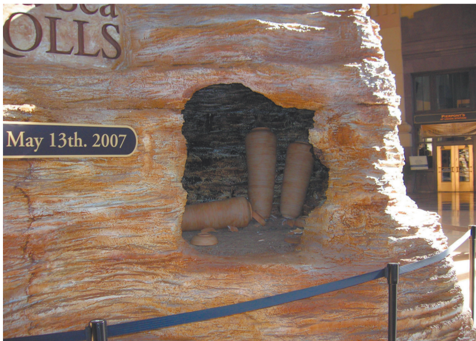
Кумранские свитки из пергамента хранились в таких глиняных сосудах более двух тысячелетий