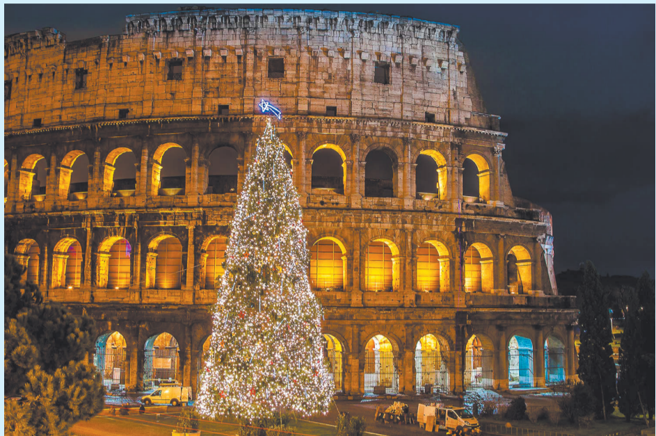
Рождественская ель у стен римского амфитеатра – свидетеля верности и страданий множества христиан

Рождество и Новый год числятся среди самых «вкусных» итальянских праздников. По традиции, на эти праздники семья собирается не только для того, чтобы обменяться подарками, но и вспомнить о том, как весело бывает за семейным столом. Многие итальянцы до сих пор по древней традиции выбрасывают из окон старые вещи, расставаясь со всеми неприятностями, которые принёс старый год.