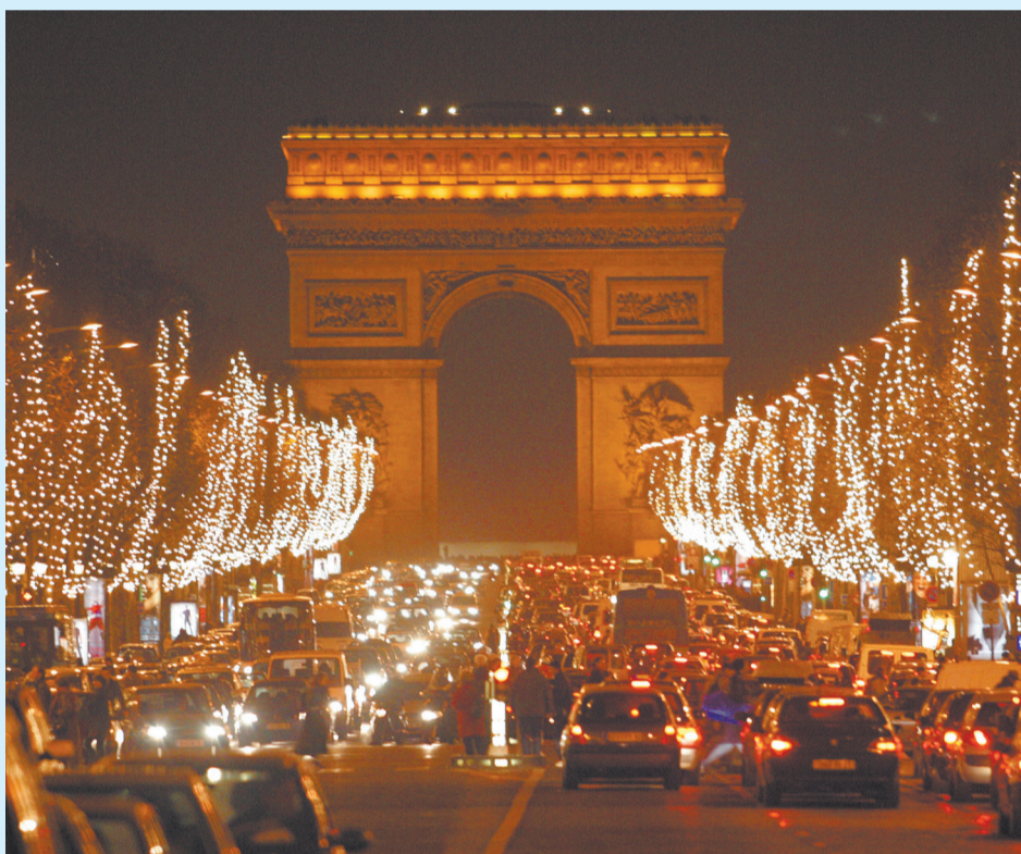
Рождественские дни во Франции

На Рождество французы любят изображать само событие, поэтому повсюду в витринах, в домах в эти дни можно увидеть множество сцен рождения Христа: с яслями, агнцами и маленькими кукольными глиняными человечками, изображающими младенца. Улицы городов, а особенно столицы, празднично украшены.