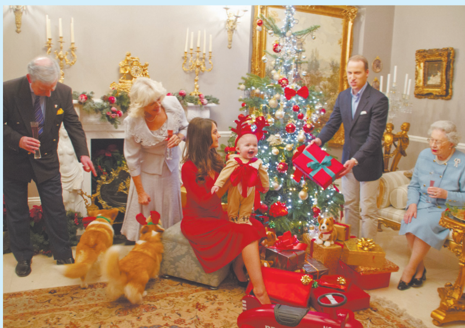
Рождество в королевской семье. Великобритания

В этой стране, где более всего ценят традиции, немым атрибутом праздника является короткая речь королевы, которую она произносит сразу после рождественского обеда. В Англии Рождество – настоящий семейный праздник. В этот день все собираются в родительском доме, дарят друг другу подарки, проводят время за праздничным столом и просматривают семейные фотографии.