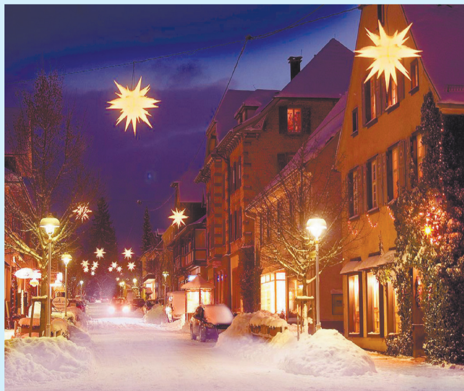
Рождество в Дании

На улицах и площадях появляются гирлянды, красные сердца из бумаги и шёлка и соломенные козлики. На главной городской площади возле ратуши ставят центральную ель, а под ней – большой стеклянный ящик, куда бросают деньги для бедных детей из других стран. В эти дни датчане стараются встретиться со всеми своими знакомыми, друзьями и родственниками, на которых не хватало времени весь год.