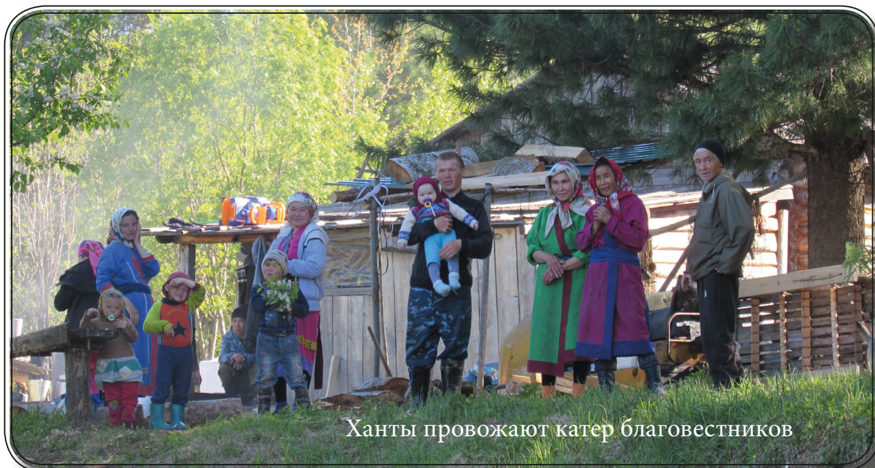
Ханты провожают катер благовестников

бралось около 70 человек, они разобрали почти всю литературу. В других посёлках люди тоже собирались на общения. К сожалению, бывало и по-другому.