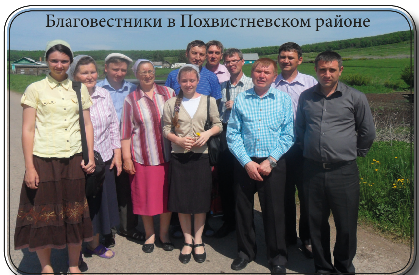
Благовестники в Похвистневском районе

В последнюю неделю мая прошло благовестие в Похвистневском районе Самарской области. Участвовало двенадцать человек из нескольких церквей братства. Были хорошие встречи, незапланированные общения, люди принимали Слово Господне. Вечерами в парках проводили общения. Играли на двух скрипках, гитаре.