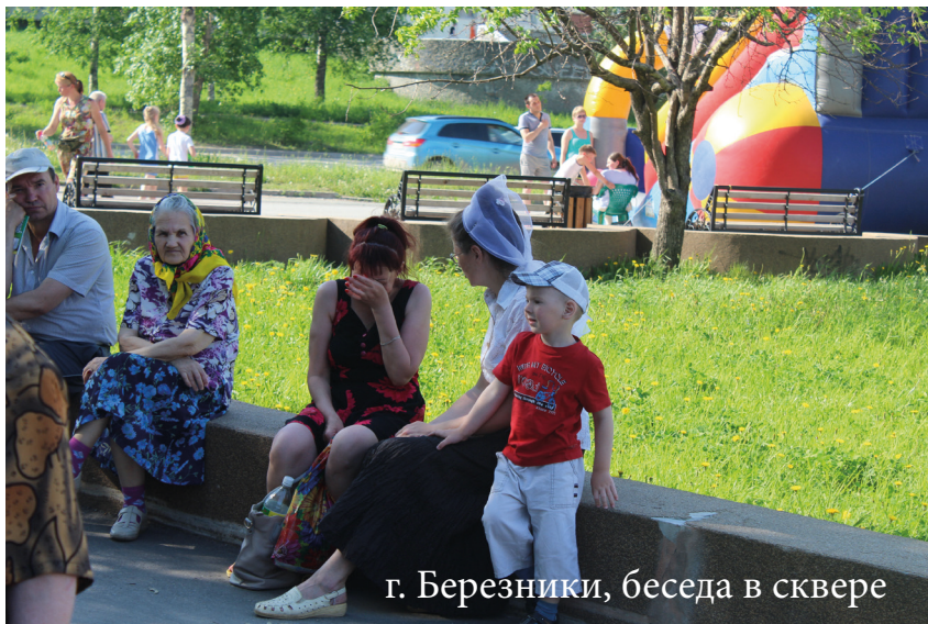
г. Березники, беседа в сквере

Не в первый раз так получается: когда что-то не договариваем при знакомстве с местными властями, выходит не очень хорошо. Лучше договаривать всё,