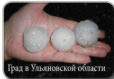
Град в Ульяновской области

Местные жители хорошо брали духовную литературу, особенно газету «Веришь ли ты?». Слава Богу!