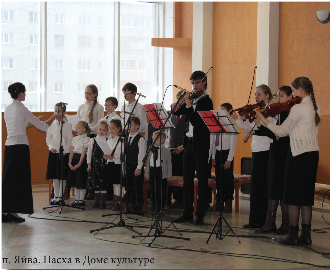
п. Яйва. Пасха в Доме культуры