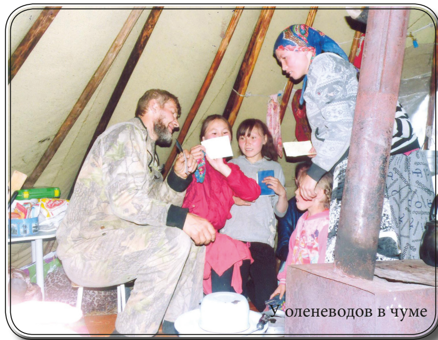
У оленеводов в чуме

Б лаговестие в Кунашакском районе Челябинской области проходило с 13 по 17 июля. Участвовали братья и сёстры из церквей Челябинска и Кыштыма (13 человек). Шли от дома к дому как книгоноши. В населённых пунктах этого района проживают в основном представители народов, традиционно исповедующих ислам. Однако многие люди принимали благовестников хорошо.