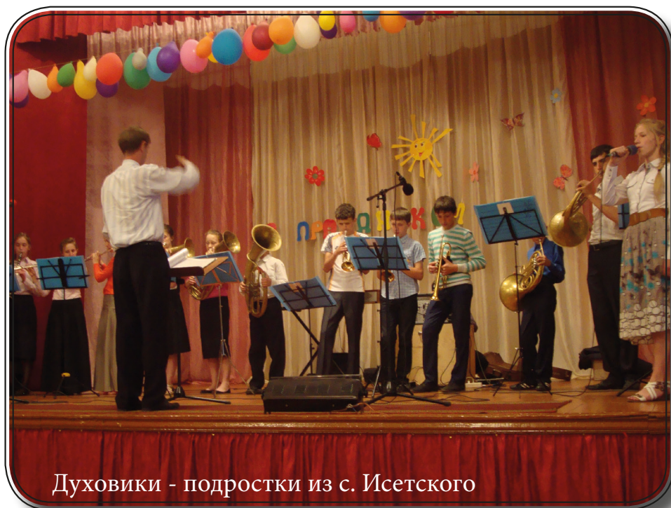
Духовики - подростки из с. Исетского

Друзья записывали адреса тех людей, кто пожелал ещё встречаться с христианами.