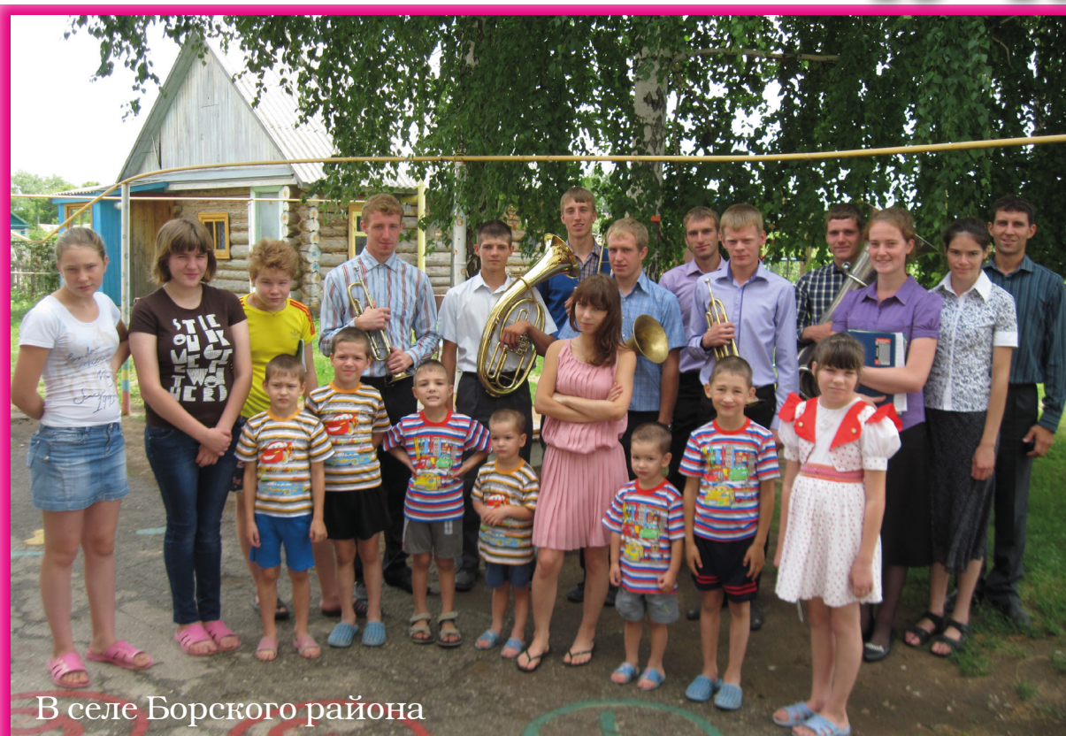
В селе Борского района

13 июля. Наша группа состояла из 13 братьев и 4 сестер, был духовой ансамбль из г. Отрадного. Утром поехали в село Старую Александровку. Слово Божие люди принимали не очень хорошо. Приглашали на служение в 13 часов дня. На служении играл духовой ансамбль, но из-за очень сильного ветра ничего не было слышно. Тем не менее, пришли трое мужчин, которые с радостью взяли христианскую литературу. После обеда поехали в село Петровку и Новую Покровку. Литературу принимали, Слава Богу, хорошо. Были очень