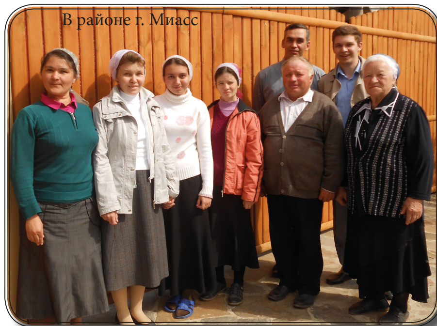
В районе г. Миасс

Группа благовестников, собранная из церквей Челябинской области, с 8 по 12 июня трудилась в районе города Миасса. Ходили по двое из дома в дом, раздавали духовную литературу, свидетельствовали о Христе, желающим пели. В некоторых деревнях раздавали Евангелие от Матфея на татарском языке. Два раза побывали в миасском парке отдыха. В сопровождении гитары пели христианские гимны, разда-