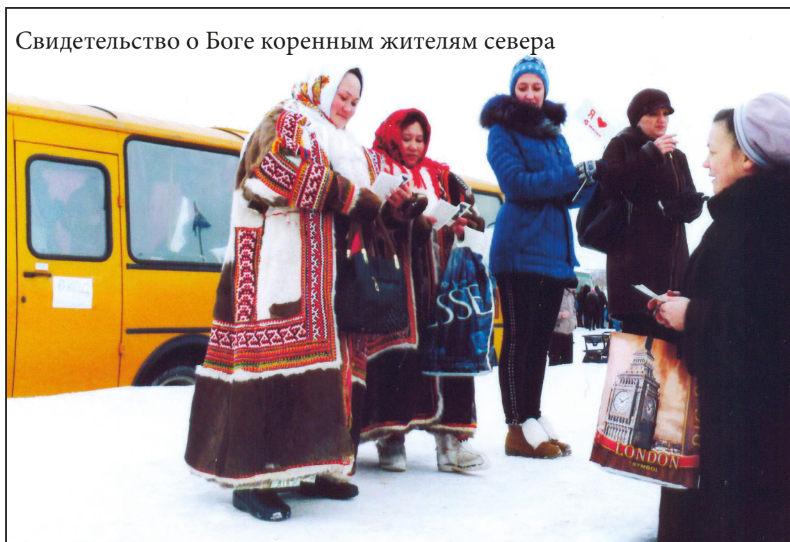
Свидетельство о Боге коренным жителям севера