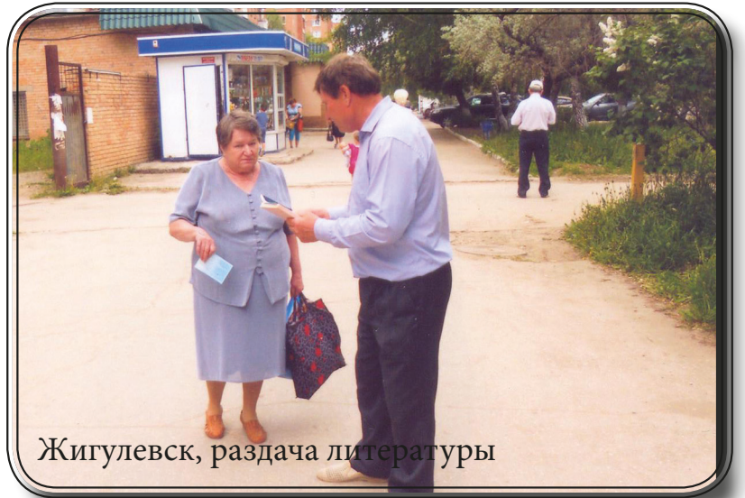
Жигулёвск, раздача литературы

За эти дни братья и сёстры раздали около 700 Евангелий и Новых Заветов, 900 дисков и 500 трактатов, много детской литературы. Да возрастит Господь посеянное! До благовестия прошло два поста, а для братьев и ночь бдения.