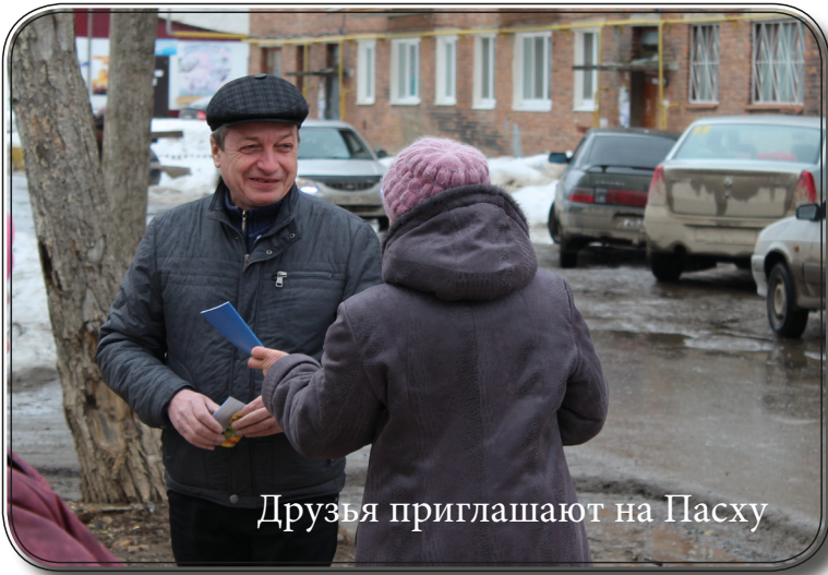
Друзья приглашают на Пасху

Как и в прежние года, братья и сёстры яйвинской церкви (Пермский край) усердно приглашали односельчан на пасхальные богослужения. На общение в ДК «Энергетик» пришло около 20 человек. Проповедники говорили о великой победе Иисуса Христа, об этом же пел детский хор, звучала скрипичная музыка.