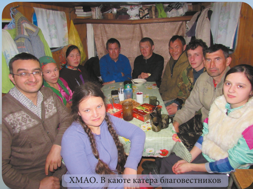
ХМАО. В каюте катера благовестников

Издание отдела благовестия Уральского объединения МСЦ ЕХБ №2 (17), 2015г.