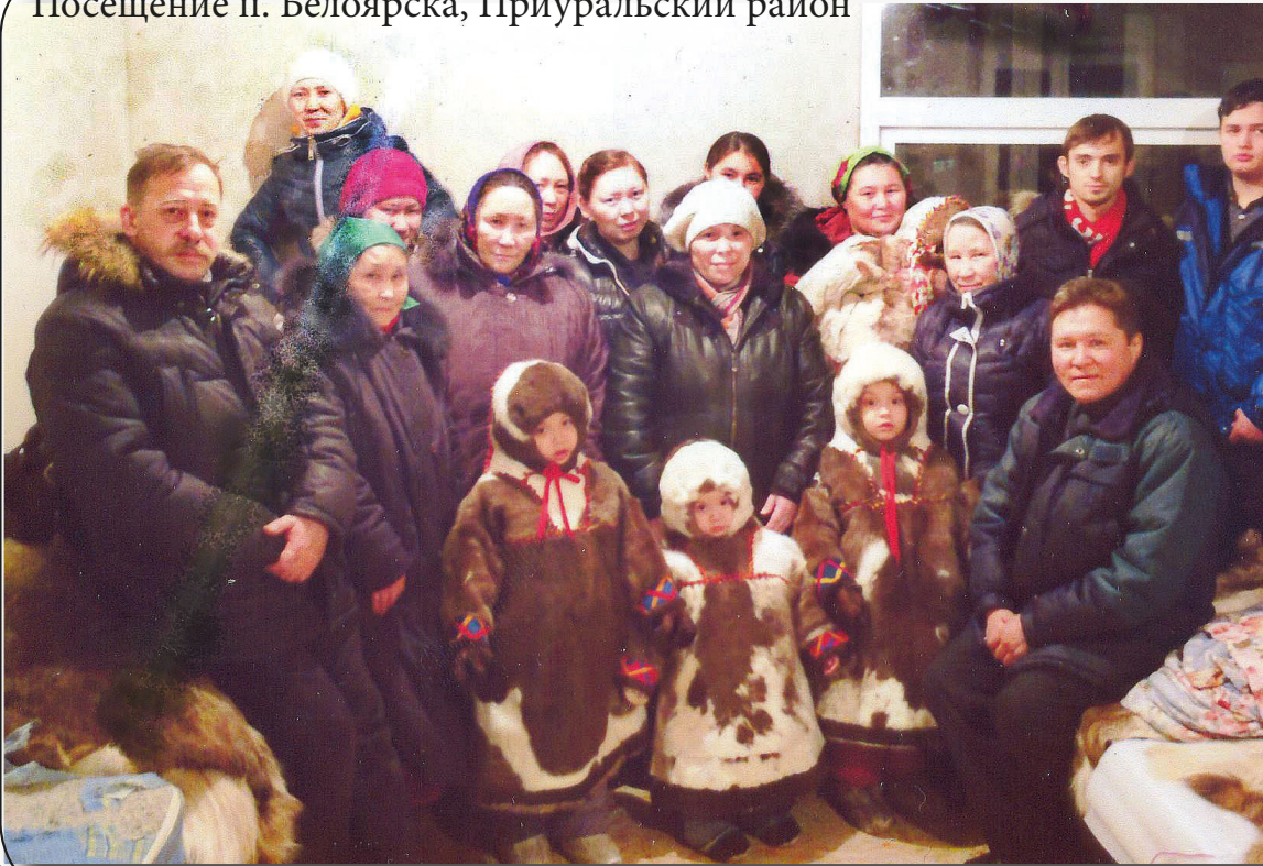
Посещение п. Белоярска, Приуральский район

В начале марта состоялось общение глухих братьев. Был составлен список городов, где решили благовествовать. Все намеченные служения состоялись. Недельное благовестие было в Актюбинске (Казахстан), имели адреса глухих, ходили по домам. Некоторые души обращались к Господу.