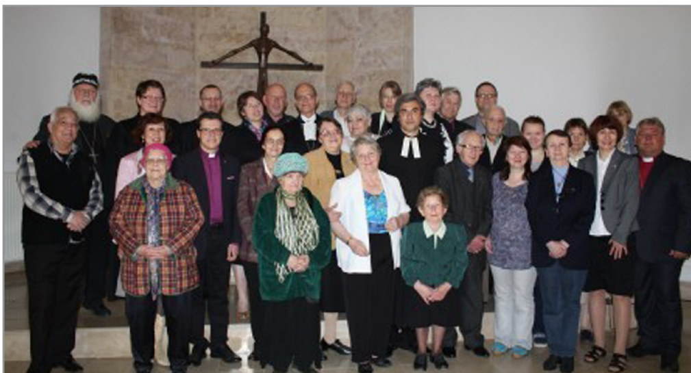
Участники заседания с прихожанами общины