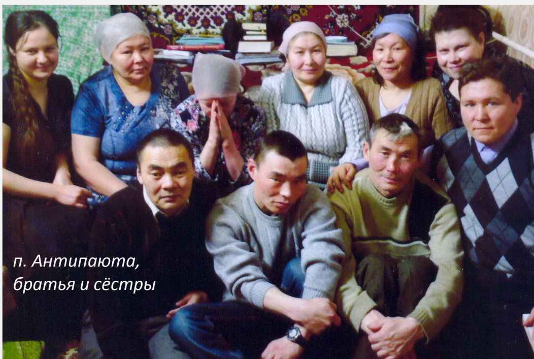
п. Антипаюта, братья и сёстры

С 27 по 31 октября, а также 4-13 января служитель из Надыма (ЯНАО) с сотрудниками благовествовали в посёлке Антипаюта, который находится на Гыданском полуострове (северо-восток ЯНАО). От Надыма до этого посёлка – 750 км на север. В основном