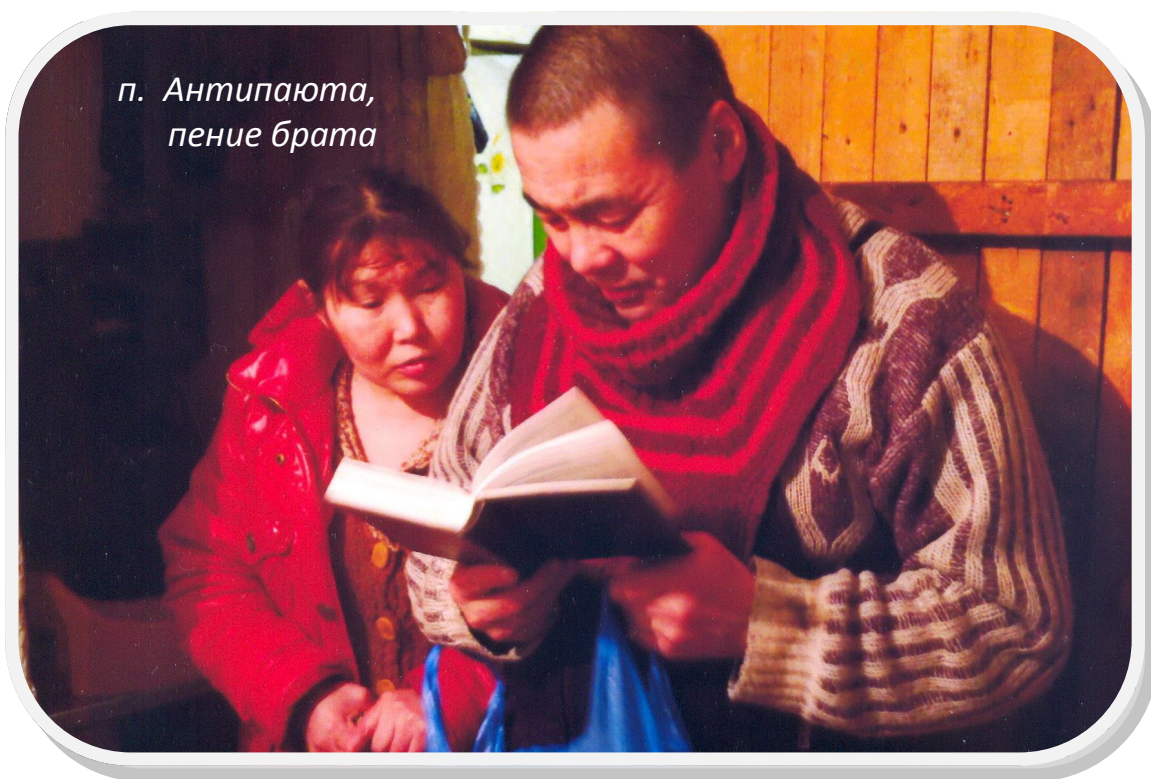
п. Антипаюта, пение брата

Гыданский полуостров. Если передвигаться с Ямала через Обскую губу на восток, то мы окажемся на Гыданском полуострове. Данная территория тоже входит в ЯНАО Тюменской области. Здесь, в Антипаюте и Гыде, есть горстки наших верующих. Ямальские миссионеры иногда посещают эти населённые пункты, часто бывать здесь не могут. В Антипаюте полгода в 2014-2015 г. г. трудились