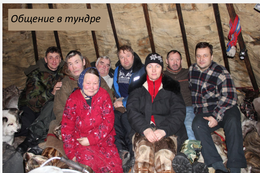
Общение в тундре

Побывали у друзей в посёлках Антипаюте и Гыде. Для труда на Гыданский полуостров приезжают братья из Красноярского края, Нового Порты, Салехарда и даже Воркуты. Общими усилиями здесь сеется Слово Господне.