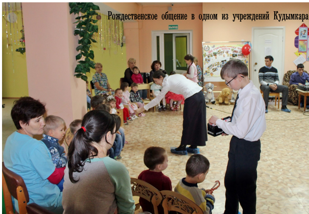
Рождественское общение в одном из учреждений Кудымкара

кандидата в цари. «Иисус же, узнав, что хотят прийти, нечаянно взять Его и сделать царём, опять удалился на гору один» (Иоан. 6, 15). Господа не интересовали такие перспективы.