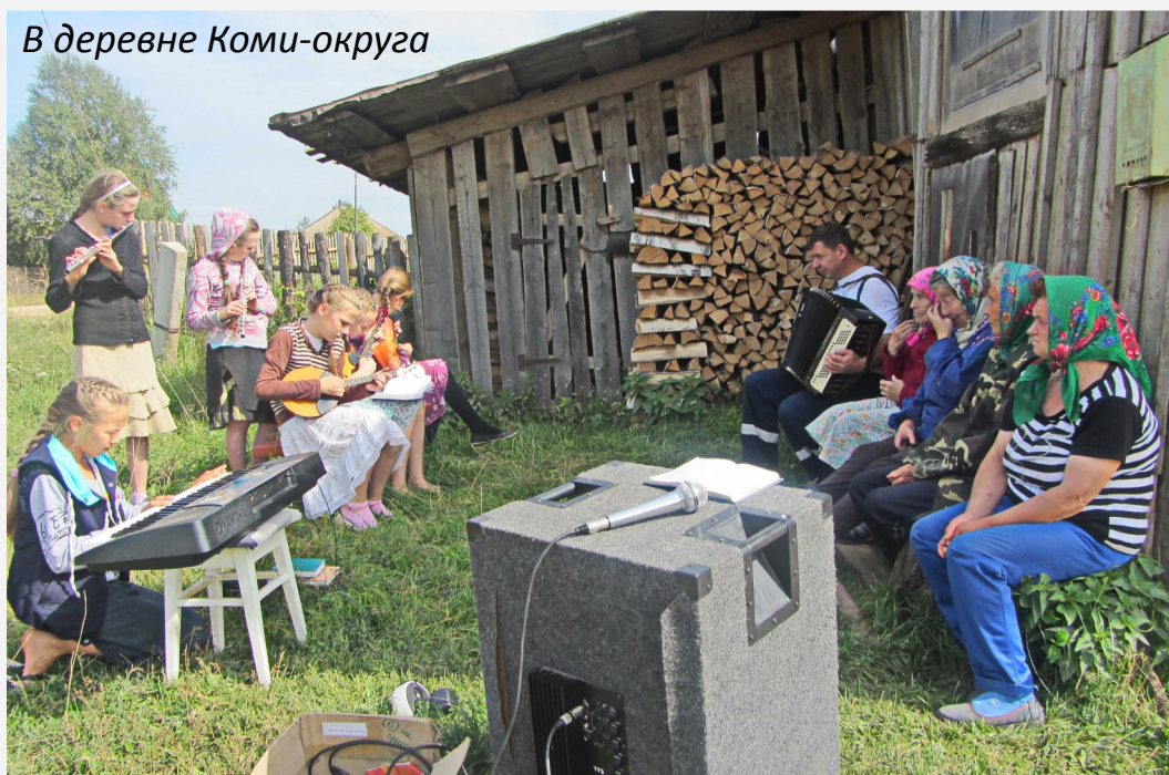
В деревне Коми-округа

19—23 августа проведено благовестие в некоторых посёлках Гаинского и Косинского районов Коми-округа (Пермский край). Участвовали подростки из христианских семей, которые составили оркестр, играли на народных инструментах. Ребята охотно участвовали в служениях.