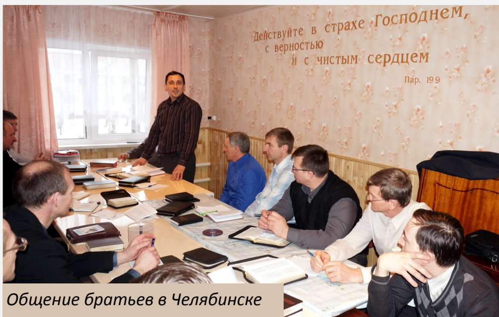
Общение братьев в Челябинске

ящее время в нашем объединении действует пять таких реабилитационных центров. В Юргамыше (Курганская область), как и прежде, служение продолжается в двух домах, в которых находится 10 человек. В Самарской области два дома: в Чекалинке (близ Похвистнево) и в Отрадном. Есть дом в Пермском крае (Куеда).