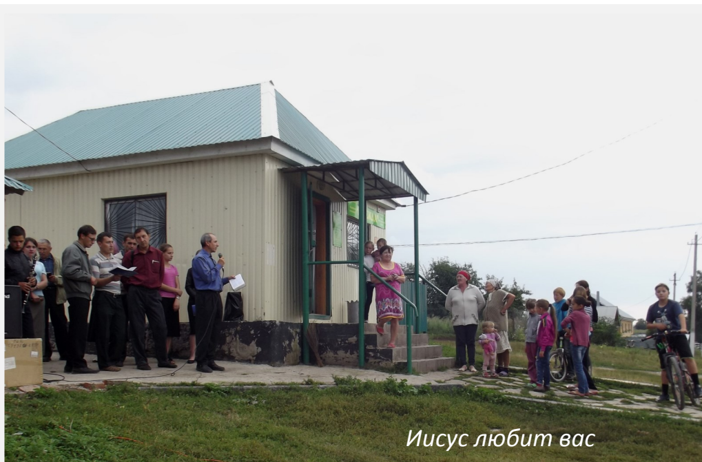
Иисус любит вас

Группа благовестников, собранная из церквей городов Давлеканово и Уфы, трудилась в Бижбулякском районе Башкирии с 4 по 9 августа. Побывали во многих населённых пунктах: Мурадымово, Исакаево, Кистенли-Ивановке, Кистенли-Богдановке, Аитове, совхозе Дёмском, Игнашкин о, Новоми-