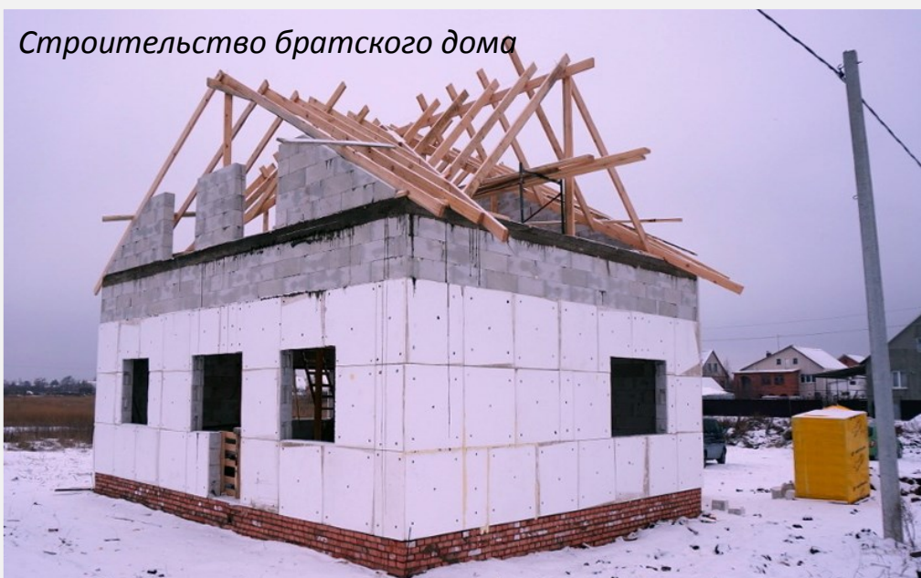
Строительство братского дома

Прошедшей зимой в г. Отрадном, на участке, расположенном недалеко от молитвенного дома, построен братский дом. Участок принадлежит одному из местных братьев.