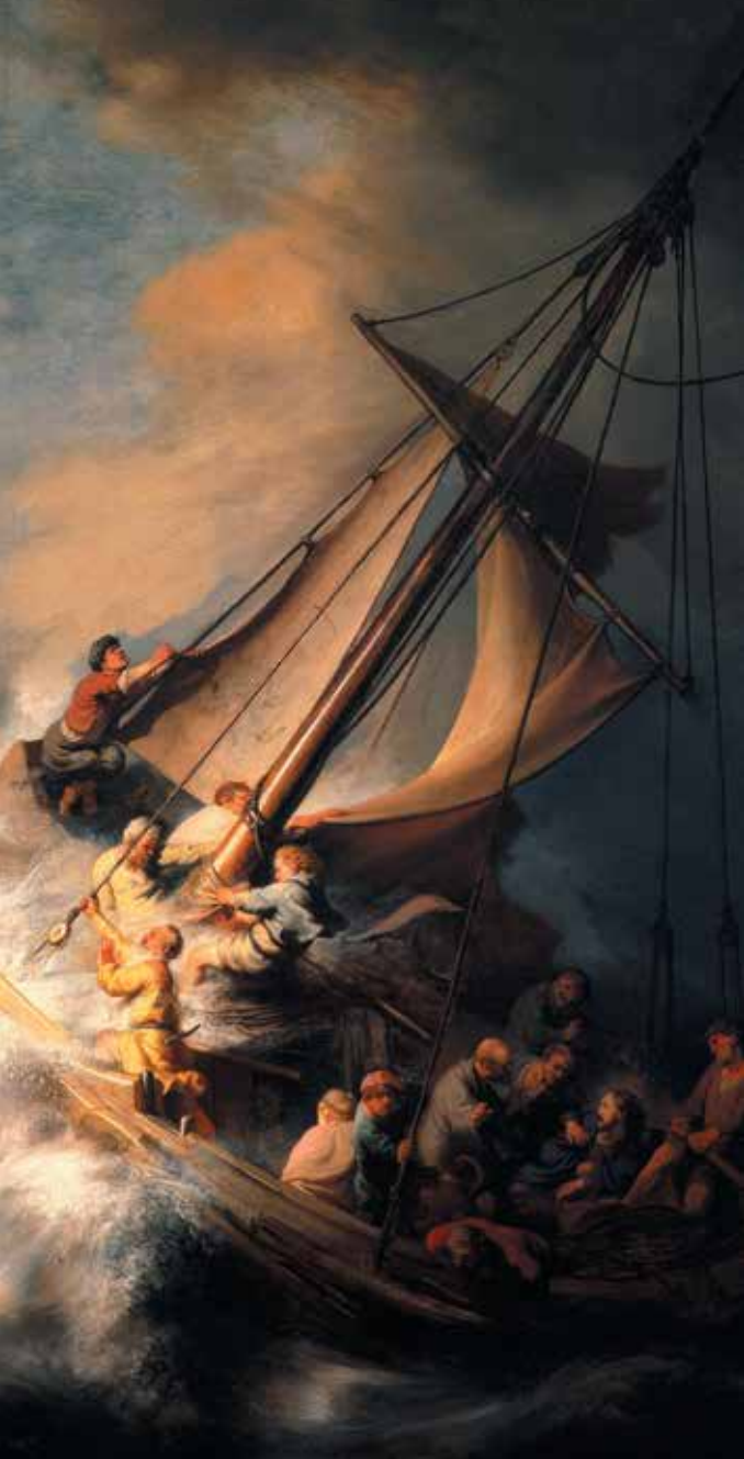
Рембрант Харменс ван Рейн. Христос во время шторма на море Галилейском. 1633

«Христос во время шторма на море Галилейском» — единственный морской пейзаж кисти Рембрандта. На нем художник запечатлел момент из евангельской истории, записанной в Евангелии от Луки (8:22-25).